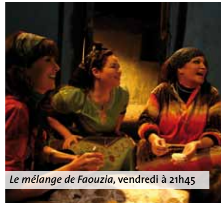
Le mélange de Faouzia, vendredi à 21h45