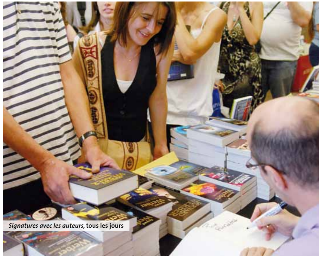
Signatures avec les auteurs, tous les jours