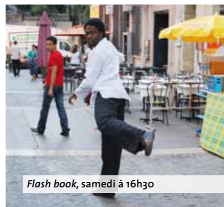
Flash book, samedi à 16h30