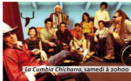
La Cumbia Chicharra, samedi à 20h00

Découvrez les propositions des candidats pendant tout le week-end sur le kiosque à musique. Les résultats de ces concours seront annoncés le dimanche 13 juin 2010 à 16h00.