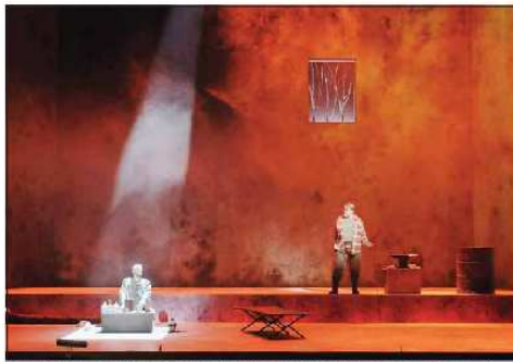
► Jeudi soir au Parc Jourdan, les instants d'été retransmettent sur écran géant, en direct du GTP, "Le Crépuscule des dieux" de Richard Wagner.

À ceux qui s'y seraient pris trop tard pour obtenir des places à l'opéra, "Les instants d'été" ont la solution. Ils retransmettent en direct du festival d'art lyrique deux des productions programmées cette année. C'est ainsi que l'on retrouve jeudi au Parc Jourdan le troisième et dernier volet de la tétralogie de Wagner, mis en scène par Sir Simon Rattle, "Le Crépuscule des dieux". En amont de cette projection, sera diffusée une sélection de courts-métrages par les Rencontres cinématographiques