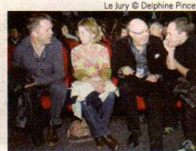
Le Jury